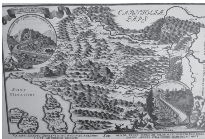
Slika 2 karta Karolinske ceste - Via nova augusto Caroli VI... ; Weiss, M. A. Beč, 1736.

U ljeto 2025. godine započeli su radovi na parkiralištu u centru naselja, čija je vrijednost radova 134 tisuće eura. Od tog