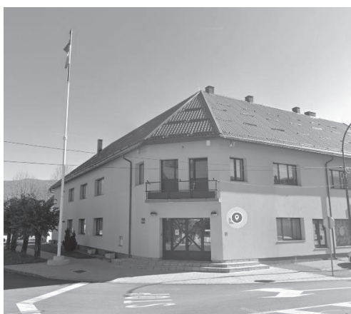
Slika 4 Dom kulture Mrkopalj

Najviše aktivnosti održava se u Domu kulture Mrkopalj, jer ima brojne funkcije – kongresno - koncertna dvorana i kino dvorana.