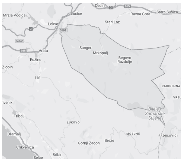
Slika 1 Geografski položaj Općine Mrkopalj

Gospodarske su djelatnosti isprepletene i međuovisne, a putem podjele rada, razmjene, organizacije proizvodnje i upravljanja čine temelj društvenog života. Na stanje i razvoj gospodarstva utječu raspoloživost prirodnih i proizvedenih sredstava, ljudsko znanje i sposobnosti njegove uporabe kao i organizacijski oblici i društvene institucije koje reguliraju i usmjeruju gospodarske napore te raspodjela njihovih rezultata.