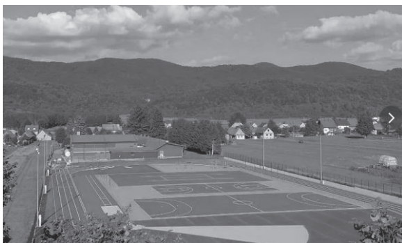
Slika 6 Atletska staza Mrkopalj

Na području Općine nalazi se i nogometno igralište kao i biciklističke staze koje se protežu od Mrkoplja, preko Begovog Razdolja, Tuka, Sungera do Bjelolasice. Okružuje ih prekrasan