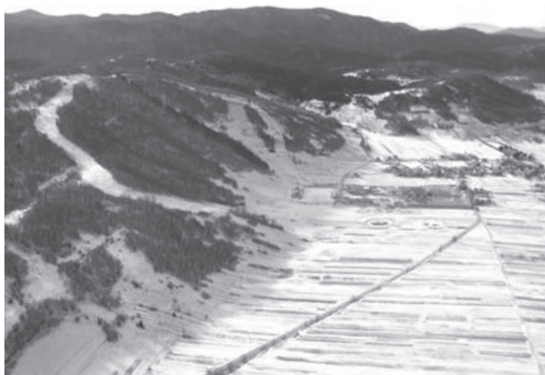
Slika 5 Skijaške staze Čelimbaša iznad naselja Mrkopalj

Mrkopalj je poznat po razvijenom alpskom i nordijskom skijanju, te biatlonu; čemu svjedoče razni sportski klubovi – Skijaški klub Mrkopalj, Skijaški klub „Bjelolasica”, Biatlonski klub „Bjelolasica”.