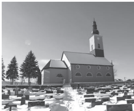
Slika 6 Katolička crkve BDM Žalosne - Mrkopalj

Na području Općine Mrkopalj nalazi se nekoliko dječjih igrališta, parkova i uređenih zelenih površina.