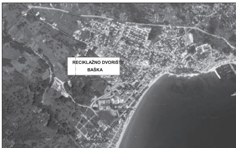
SLIKA 2: LOKACIJA RECIKLAŽNOG DVORIŠTA BAŠKA

Reciklažno dvorište Baška nalazi se na k.č. 2945, k.o. Baška i površine je 2.155 m 2 . U reciklažnom dvorištu prikupljaju se sve vrste otpada u skladu s Dodatkom IV. Pravilnika o gospodarenju otpadom (NN 117/17).