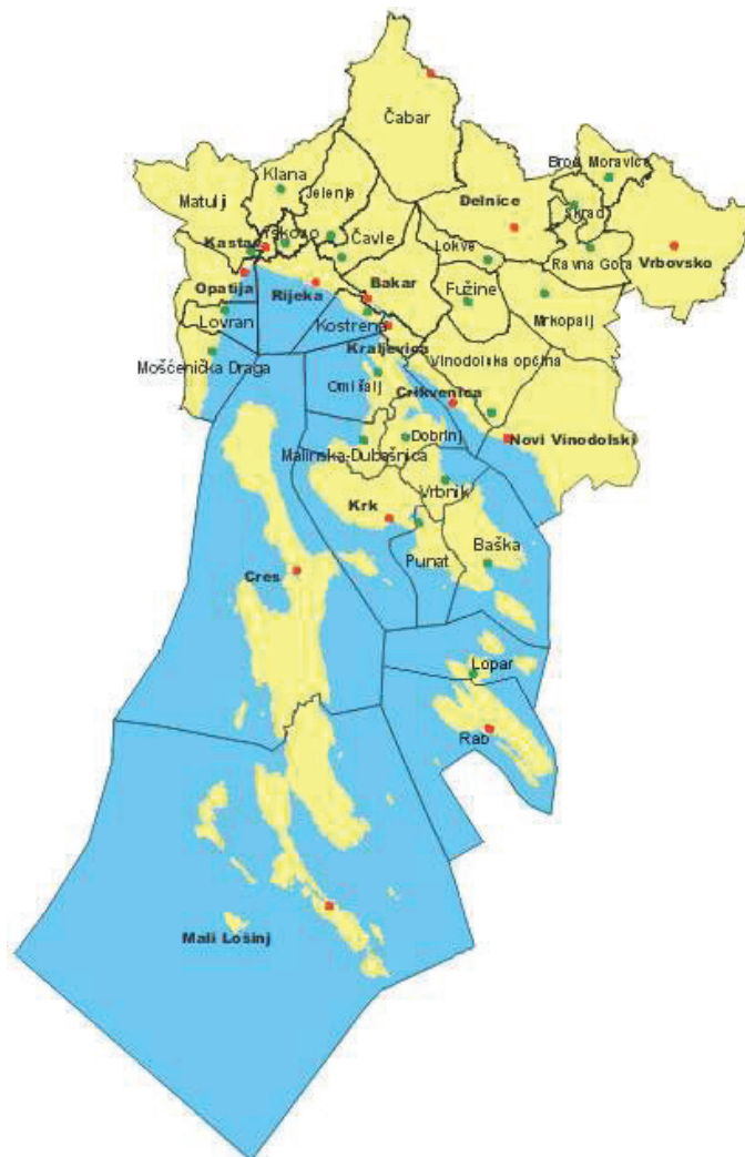
Slika 1. Položaj Općine Vinodolske općine u području Primorsko-Goranske županije