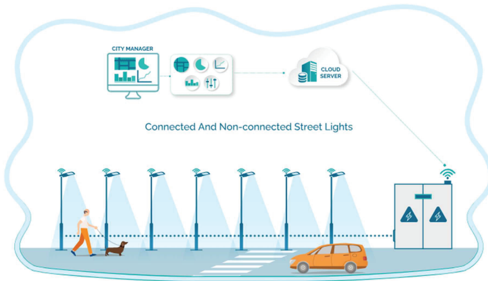
Slika 3. Slikoviti prikaz kompletnog sustava javne rasvjete