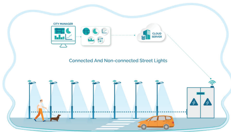
Slika 1. Slikoviti prikaz sustava vanjske rasvjete

Planovi predstavljaju podloge za projekte vanjske rasvjete i izradu Akcijskog plana. Bitno je razvoj rasvjete usmjeriti i uskladiti s zakonom o zaštiti od svjetlosnog onečišćenja. Najvažnije komponente vanjske rasvjete koje bitno utječu na provedbu zakona prikazani su na slici ispod.